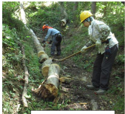
伐倒した倒木を玉切りしトビロを使い運搬・処理

お昼までの時間で烏帽子峰に登る遊歩道の新たに発生していた枯れアカマツの倒木処理を行った。自然園東側遊歩道沿いにもかかり木があったが、直ちに危険がないことと、処理がかなり難しいことからしばらく様子を見ることにした。