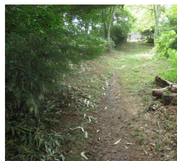
スッキリした遊歩道