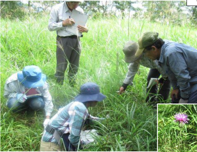
草をかき分けて探す

調査者が多く、ていねいにやると、丈の低い開花植物やさらには開花していない個体も発見することができた。多少の誤差はしかたがないとしても、今後ていねいに調査することを心がける必要があると感じた。