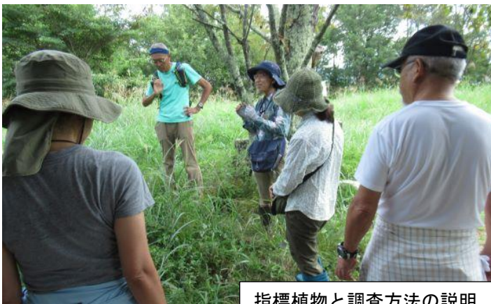
指標植物と調査方法の説明

また、同時に2015年に蝶の森の草原内に設けた3カ所の2m四方の耕起実験区(10cmほどの深さで耕し、土壌を混ぜ返した場所)の植物調査も行った。この調査は多様な在来の草原の植生を維持することを目指すための試験的な経年調査である。