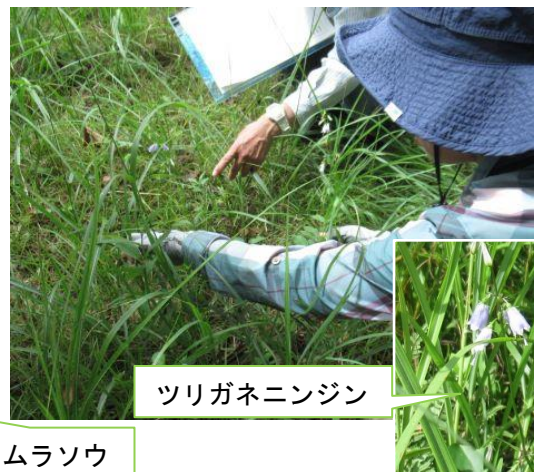
ツリガネニンジン