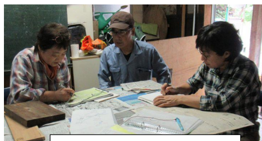
作製する案内板のチェック

きより館に集合し、案内板などの作製準備を行った。まず長峰山散策マップと照らし合わせて、作製