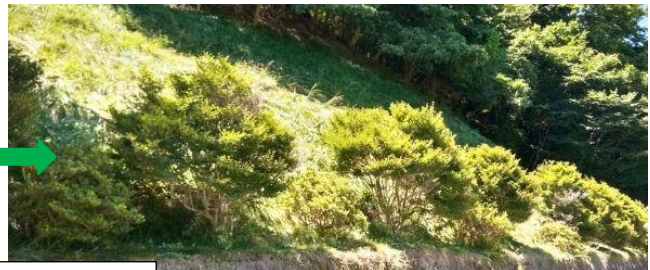
きより館前の斜面の草刈り

その後、きより館で矢ノ沢地区のみなさんとの交流会を行った。今年は矢ノ沢の常会長さんが竹を切り出し、流しそうめんの準備をしてくださり、暑さの中でしばし冷たいそうめんに涼を感じ、美味しく楽しいひとときであった。