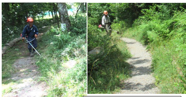
草刈りと刈り草の片付け