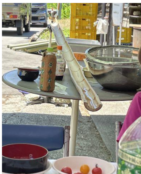
流しそうめん準備中

年に4回（1月の三九郎、4月の側溝ざらい、7月の草刈り、11月の側溝ざらいと新年の準備）毎回活動後の交流会では趣向を凝らした企画を考え合い、矢ノ沢地区のみなさんと森倶楽部21会員との楽しい昼食会である。