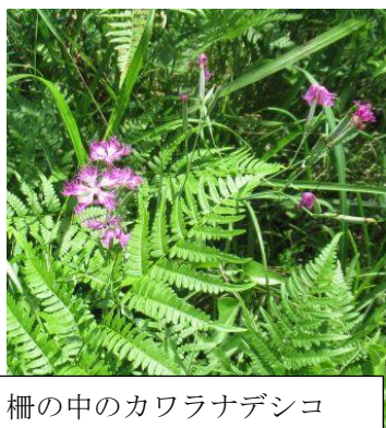
柵の中のカワラナデシコ