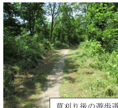
草刈り後の遊歩道

前回やり残したチョウの道沿いの草刈りと道に張り出した枝を処理した。終了後に烏帽子峰の遊歩道に移動する予定であったが、思ったより時間がかかったことと移動時間がもたないということで蝶の森から山頂に向かう ちょうちょう 蝶頂遊歩道沿いの草刈りを行い、蝶の森入口から長峰山山頂への出口まで全線の草刈りを終えることができた。